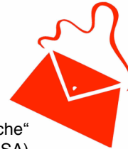
Kampagnenlogo „Initiative Rote Tasche“