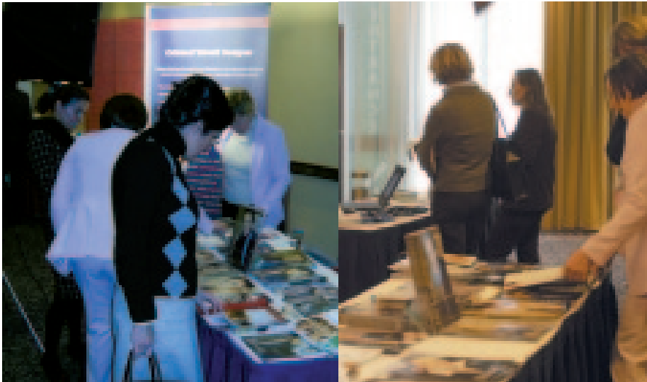
Was ist der ImageDesigner? Die meist gestellte Frage an unserem Stand. Die Antwort stößt auf positives Feedback: mehr als ein Magazin. Eine Plattform !!!

Absolut gelungen und außerordentlich gut organisiert: nur so können wir die Erfolg 2006 bezeichnen. Das Karriereforum für Frauen am 4.März erlaubte Business-Women, Wissbegierigen und Praktikerinnen sich ausgiebig auszutauschen. Als Aussteller haben wir sehr anregende Begegnungen gehabt und uns sehr wohl gefühlt. Das nächste Mal werden wir sicher wieder dabei sein und können diese Plattform wärmstens weiterempfehlen. Hinter dieser Messe steht übrigens BPW. „Business And Professional Women“ (BPW) ist eines der einflussreichsten, überparteilichen und überkonfessionellen Frauennetzwerke der Welt und hat in Europa etwa 22.000 Mitglieder. Im Vordergrund steht die Förderung der Verständigung und Vernetzung berufstätiger Frauen, aber auch zahlreiche weitere Engagements, wie Förderung von Aus-, Fort- und Weiterbildung von Frauen, Job-Shadowing und nationales Mentoring-Programm und vieles mehr.