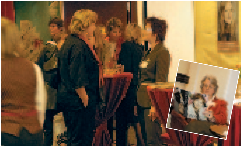
Großes Interesse an Albrecht Your Life® - nach dem Vortrag unserer Expertin für Business Coaching ist die Nachfrage groß (siehe Kolumne „richtig gecoacht“)