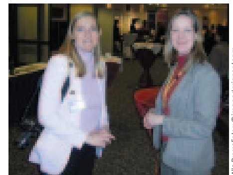
Taschen voller Visitenkarten, müde und glücklich nach der Messe!